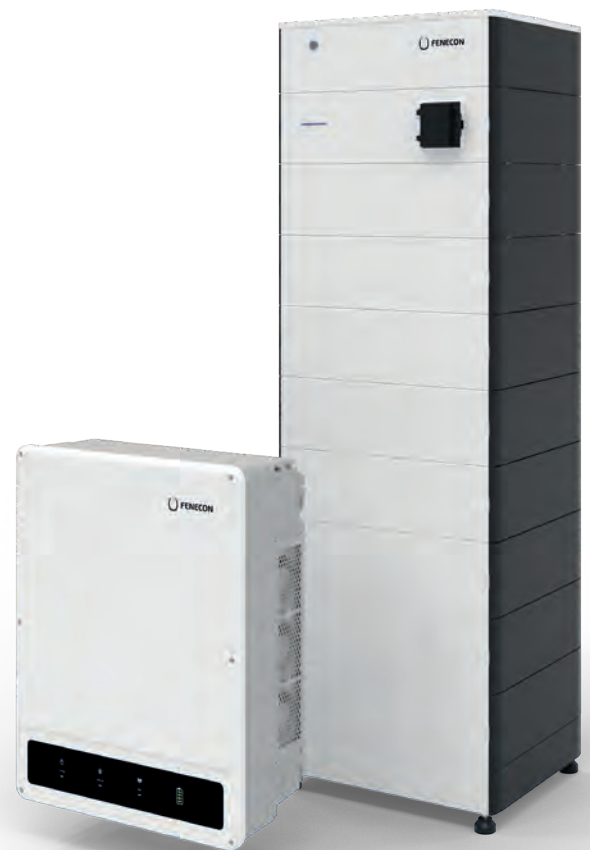
(22,4 kWh Systemvariante)